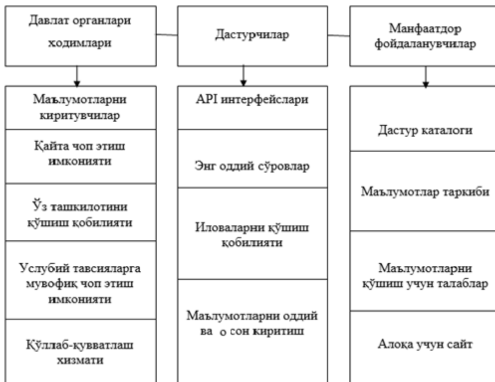
1-расм. Очик маълумотлар порталининг ҳозирги кундаги юритилиши ҳолати таҳлили 1

Мамлакатимизда очик маълумотлар тизимини жорий этиш орқали қуйидаги натижаларга эришимиз лозим: